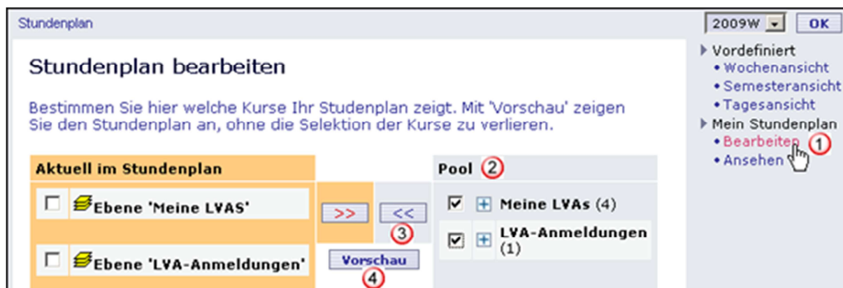
Abbildung 2: LVA-Auswahl

Sie haben die Möglichkeit Ihren „Stundenplan“ zu bearbeiten (siehe Abbildung 2: LVA-Auswahl).