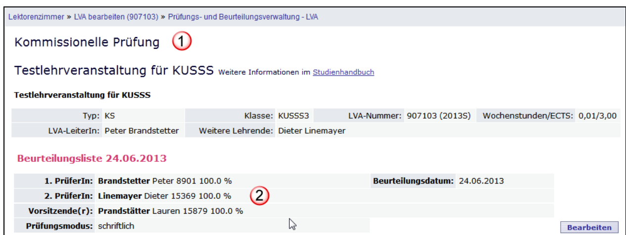
Abb. 6: Beurteilungsliste kommissionelle Prüfung

Sie erkennen, dass es sich um eine Beurteilungsliste für eine kommissionelle Prüfung handelt, an der Bezeichnung „Kommissionelle Prüfung“ (1) und an der Auflistung der Prüfungskommission (2).