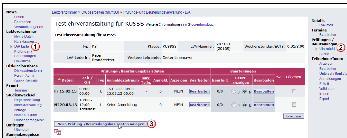
Abb. 1: Neue Prüfungs-/Beurteilungsbasisdaten anlegen

Um eine kommissionelle Lehrveranstaltungsbeurteilung zu erfassen müssen Sie zuerst entsprechende Prüfungs- bzw. Beurteilungsbasisdaten anlegen. Wählen Sie dazu analog zur „normalen“ Lehrveranstaltungsprüfung mit der LVA-Liste (1) (siehe Abb. 1: Neue Prüfungs-/Beurteilungsbasisdaten anlegen) die entsprechende Lehrveranstaltung aus. Beachten Sie dabei das korrekte Semester der Abhaltung. Wählen Sie dann im rechten Menü den Punkt „Prüfungen/Beurteilungen – Übersicht“ (2). Anschließend können Sie mit dem Button „Neue Prüfung-/Beurteilungsbasisdaten“ (3) eine neue Prüfung erstellen.