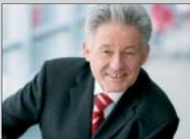
LH Dr. Josef Pühringer

Es war eine höchst verdiente Anerkennung des Einsatzes von Landeshauptmann a. D. Dr. Erwin Wenzl für das „Bildungsland Oberösterreich“, dass im Jahr 1996 - anlässlich seines 75. Geburtstages - die ÖVP Oberösterreich einen eigenen Preis für ausgezeichnete Leistungen im Bildungsbereich ins Leben gerufen und diesen nach ihm benannt hat. Damit werden alljährlich die Leistungen der oberösterreichischen Lehrlinge, Schüler und Studierenden vor den Vorhang geholt. Mit dem „Erwin Wenzl Preis“ haben wir ihm ein würdiges Denkmal für sein Wirken gesetzt.