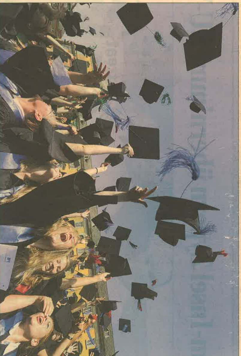
Das Studium ist zu Ende (im Bild frischgebackene Akademiker in Bonn), europaweit werden erste Schritte ins Berufsleben gesetzt. In Österreich spekulieren 40 von 100 mit einer eigenen Firma.

Das deckt sich im Wesentlichen mit den Sorgen und Nöten, die auch gestandene Unternehmer in Österreich rückblickend als größte Hindernisse auf dem Weg zur eigenen Firma angeben. Österreich ist kein Land, in dem Unternehmen besonders geschätzt wird – zumindest bisher nicht. Auch für angehende Akademiker war ein Leben als Beamter lange Zeit das Maß aller Dinge. Doch das ändert sich. Davon zeugt nicht zuletzt die Zahl neu gegründeter Unterneh-