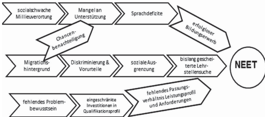
Abbildung 3: Fallbeispiel Sibel – erfolglos im Bildungserwerb, erfolglos am Arbeitsmarkt

Das Fallbeispiel macht deutlich, dass viele Faktoren wirksam sind, die zu den in der quantitativen Analyse erfassten Ursachen des frühen Schulabgangs (bei Sibel: Schulabbruch/erfolgloser