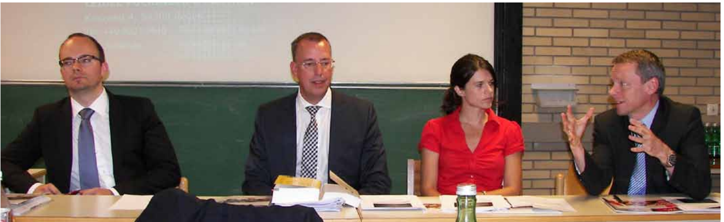
Podiumsdiskussion zu Umstrukturierungen aus umsatzsteuerlicher Sicht.