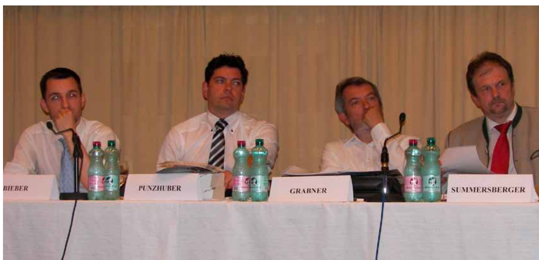
Podiumsdiskussion zu aktuellen Energiesteuerfragen.