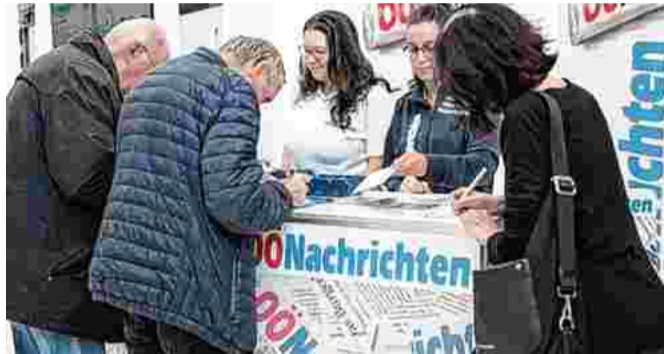
Der erste Anlaufpunkt für viele Leser, die zum Geldtag kamen: der Stand der OÖNachrichten.