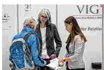
Das Interesse war groß.