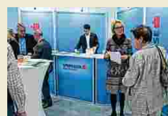
Kommunikation auf Augenhöhe

Auch bei der Hypo Oberösterreich informierten sich viele Besucher über die Geldanlage.