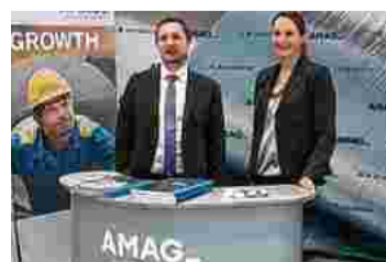
Ständen für Gespräche bereit

Der Salzburger Kranhersteller hatte auf jede Frage die passende Antwort parat.