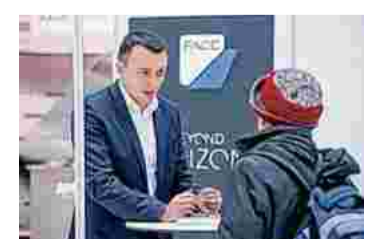
Jede Menge Informationen

In den Promenaden Galerien war auch der Sparkasse beliebte Anlaufstelle.