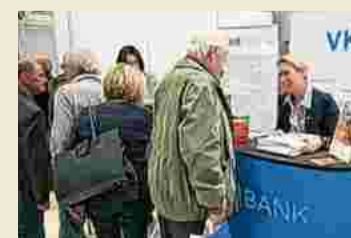
Gute Laune am VKB-Stand

Auch bei der Partner Bank und ihren Vertretern standen die Gäste Schlange.