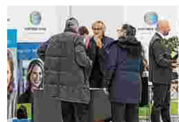
Großer Andrang am Stand

Die RLB-Experten widmeten sich ausgiebig den Besuchern am Stand.