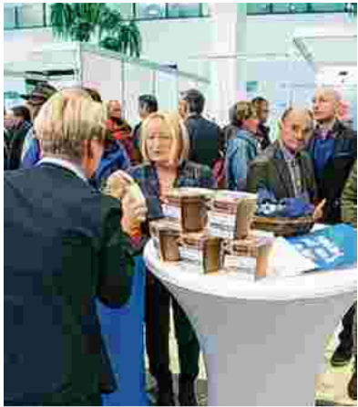
Hochbetrieb herrschte an den vielen Ständen in den Promenaden Galerien.