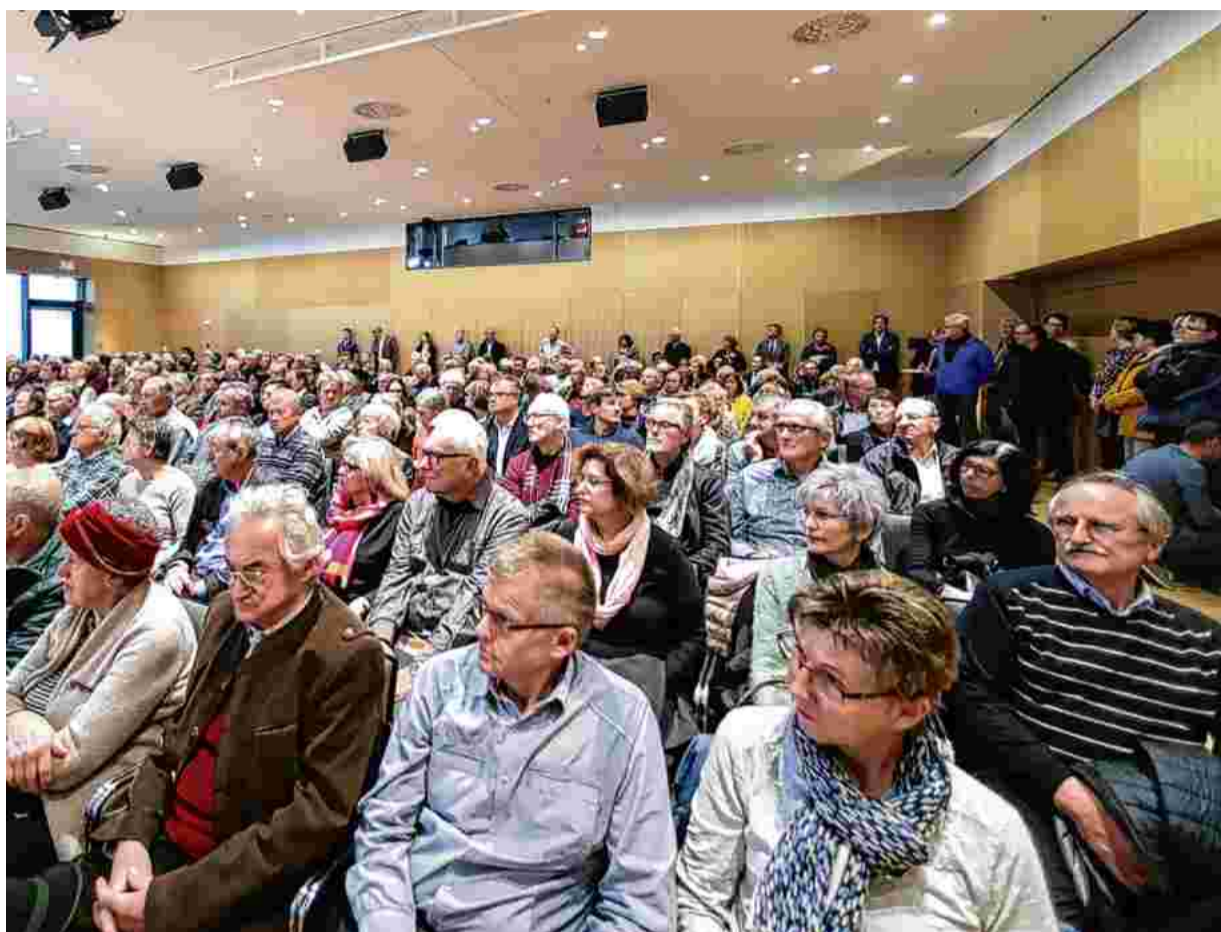
Im OÖNachrichten Forum blieb gestern Nachmittag kein Sitzplatz frei, so groß war der Andrang.

Gold, Immobilien und Versicherungen waren ebenso Thema. Tipps der Profis bei der Geldanlage gab es selbstverständlich auch. Die Grundregel: Mehr Ertrag bekommt man nur mit höherem Risiko. Das gilt nicht nur an der Aktienbörse, sondern auch bei Sparprodukten. Man darf sich auch nicht von Gier und Selbstüberschätzung leiten lassen.