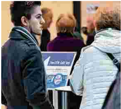
Viele Wege führten gestern Nachmittag zum OÖN-Geldtag.