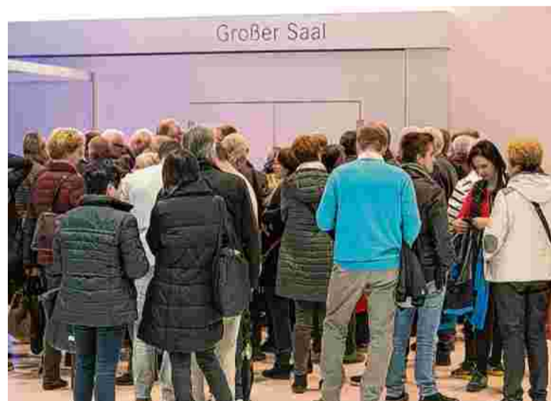
Ein Bild, das zeigt, wie groß der Andrang war: Schon vor den ersten Talkrunden stellten sich zahlreiche Leser vor dem Großen Saal an.