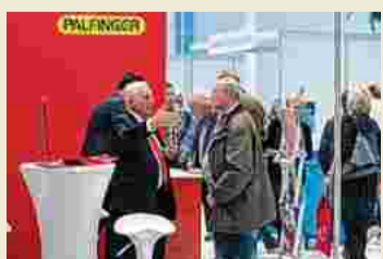
Auskunft bei Palfinger