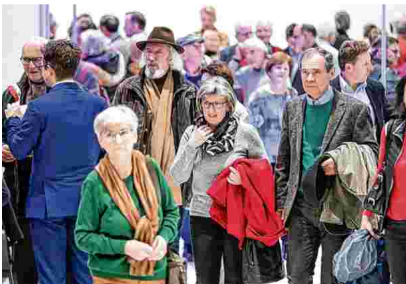
Die Linzer Promenaden Galerien erwiesen sich einmal mehr als wunderschöner und perfekter Rahmen für eine Großveranstaltung.