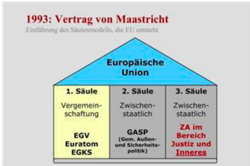
Abbildung 1: Säulenmodell im Vertrag von Maastricht

Im Hinblick auf dieses relativ mühsame Beschlussverfahren wurde allerdings bald eine Überarbeitung vorgeschlagen. 28