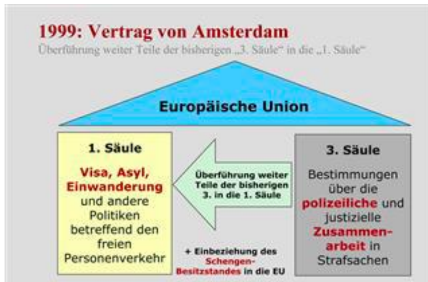
Abbildung 2: Säulenmodell im Vertrag von Amsterdam

der EU ein Konzept des Raums der Freiheit, der Sicherheit und des Rechts 31 entwickelt. Andererseits wurden einige Politikbereiche aus der dritten intergouvernementalen Säule in die erste Säule, also auf supranationales Unionsrecht, übertragen (siehe Abbildung 2).