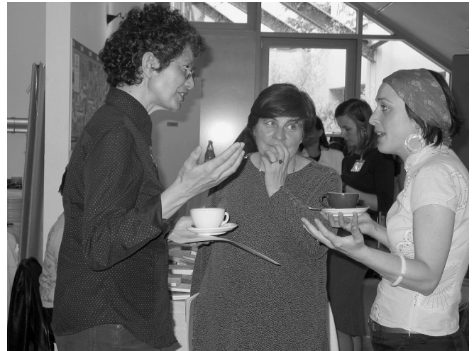
Teilnehmerinnen des Milena-Talks im Frühjahr 2004 nutzen eine Pause zum angeregten Gedankenaustausch