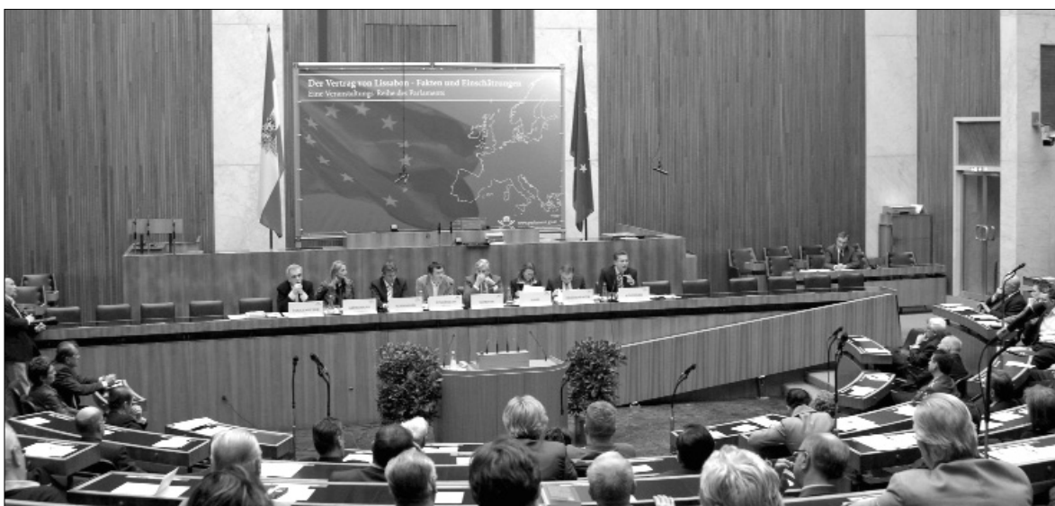
Expertenhearing zum EU-Reformvertrag im Plenum des Nationalrats.

Um ein einheitliches Auftreten der Europäischen Union nach außen zu forcieren, wird das Amt eines