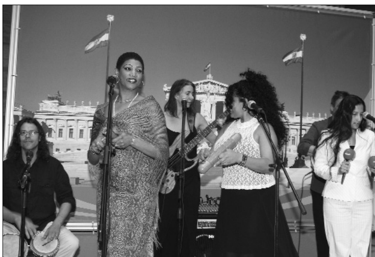
Die musikalische Umrahmung der Feiern im Parlament gestaltete die international zusammengesetzte Gruppe "de donde SON".

Geschlechterspezifische Ungleichheit gibt es auch hierzulande: So verdienen die Österreicherinnen nach wie vor nur 78 Prozent des Männereinkommens, ihr