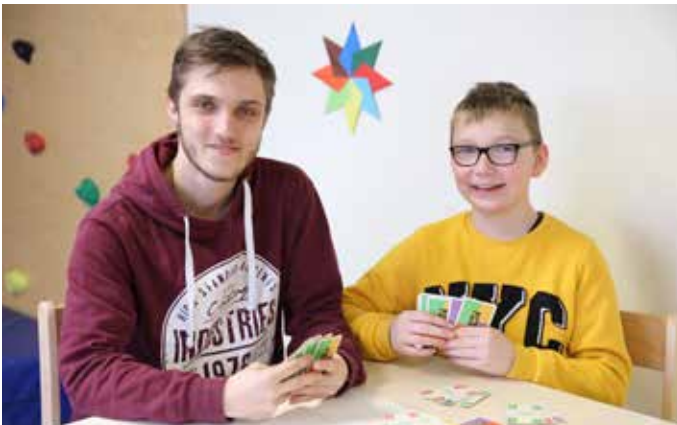
Caritas St.Isidor, Leonding