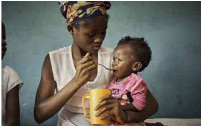
Caritas Auslandshilfe, DR Kongo (Ernährungsstation)

Diese Workshops können mit einem Schwerpunkt auf den Kongo gebucht werden.