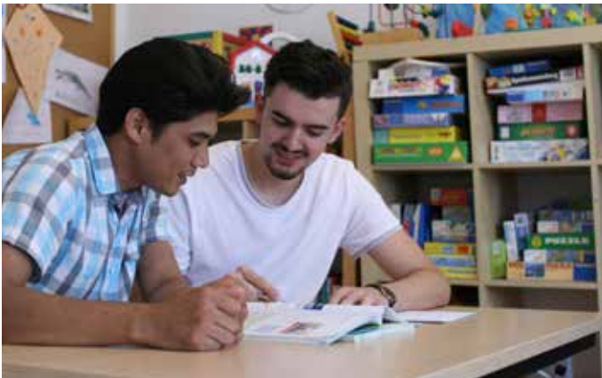
Caritas Flüchtlingshaus Waldeggstraße, Linz