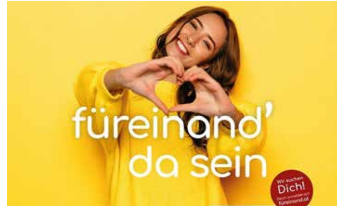
Caritas Initiative „füreinand“ gemeinsam mit der Kronen Zeitung anlässlich CoVid19