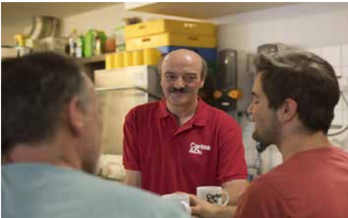
Caritas Wärmestube, Linz