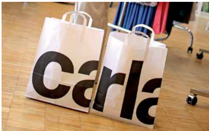
Caritas Second-Hand-Shop CARLA, Linz