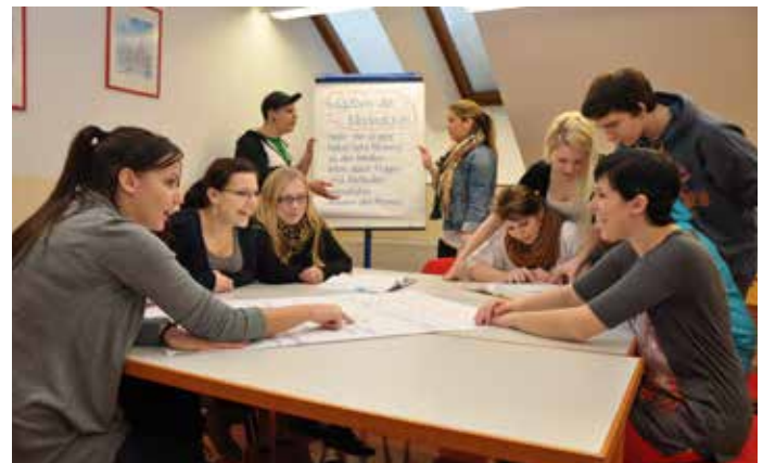
Caritas Schulzentrum Josee, Ebensee