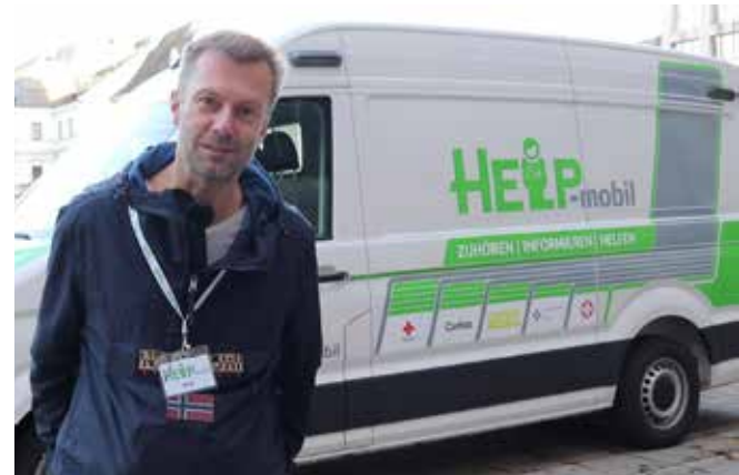
Caritas Help-Mobil, Linz