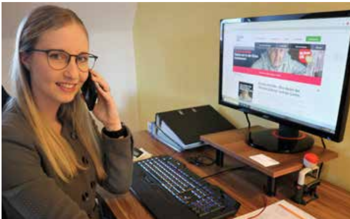
Caritas Sozialberatung, Wels

Wer: 8 - 19 Jahre; Spiel: max. 20 Personen