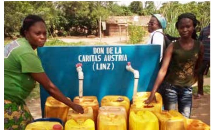
Caritas Auslandshilfe, DR Kongo