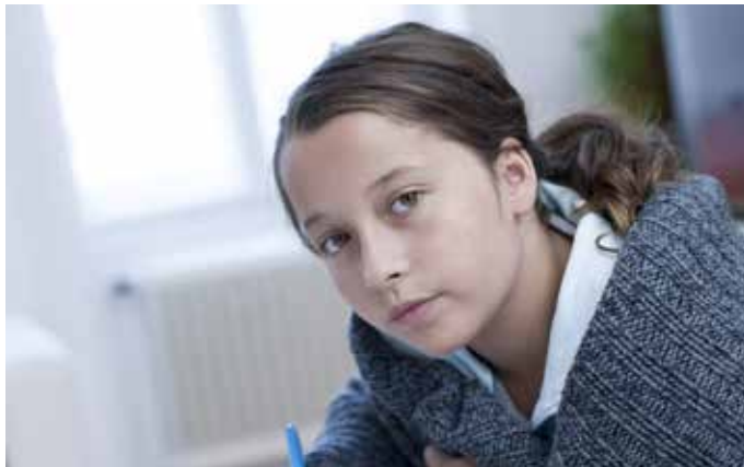
Caritas Lerncafé, Linz