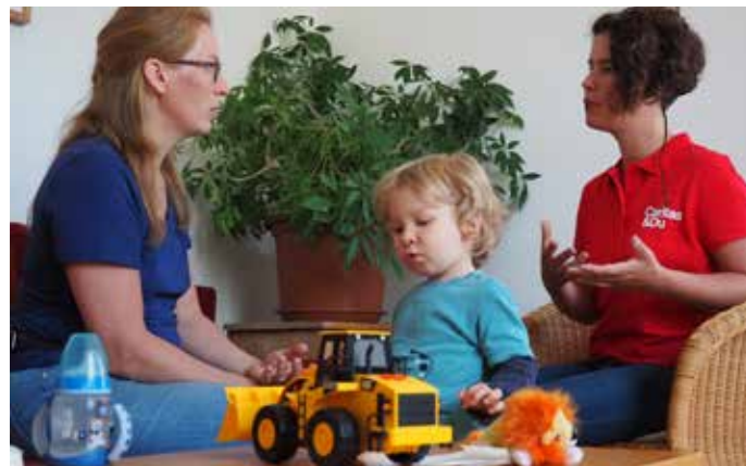
Caritas Haus für Mutter und Kind, Linz