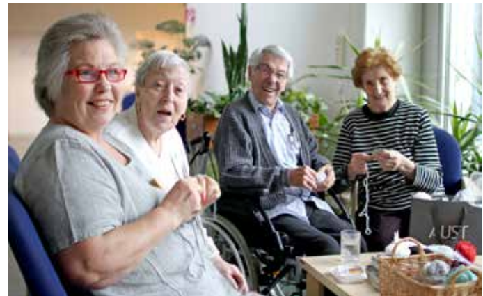
Caritas Seniorenwohnhaus St.Anna, Linz (Strickrunde)