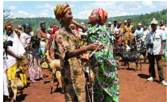
Caritas Auslandshilfe, Burundi (Versöhnungsprojekt)