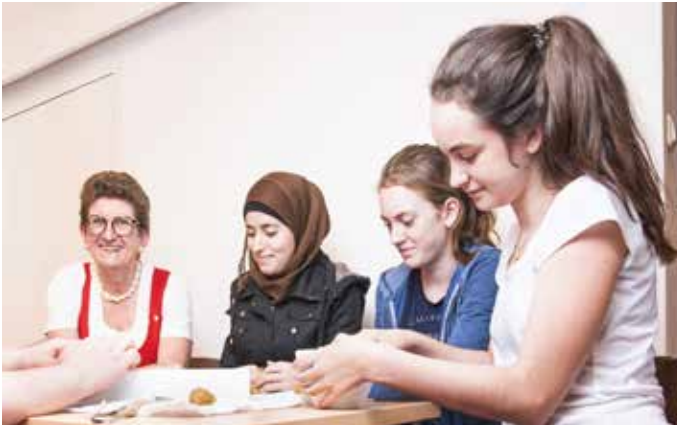
Caritas Integrationszentrum Paraplü, Steyr